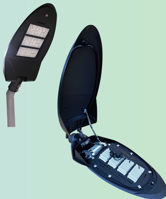
Модель ISHIM STREET