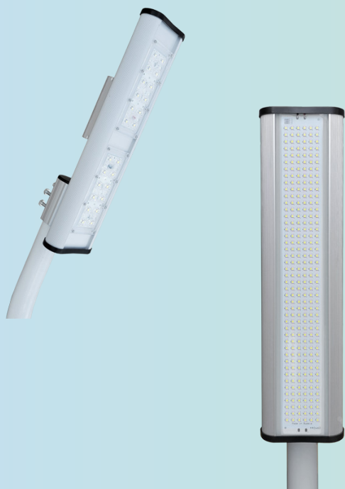
Модель ISHIM ECONOM